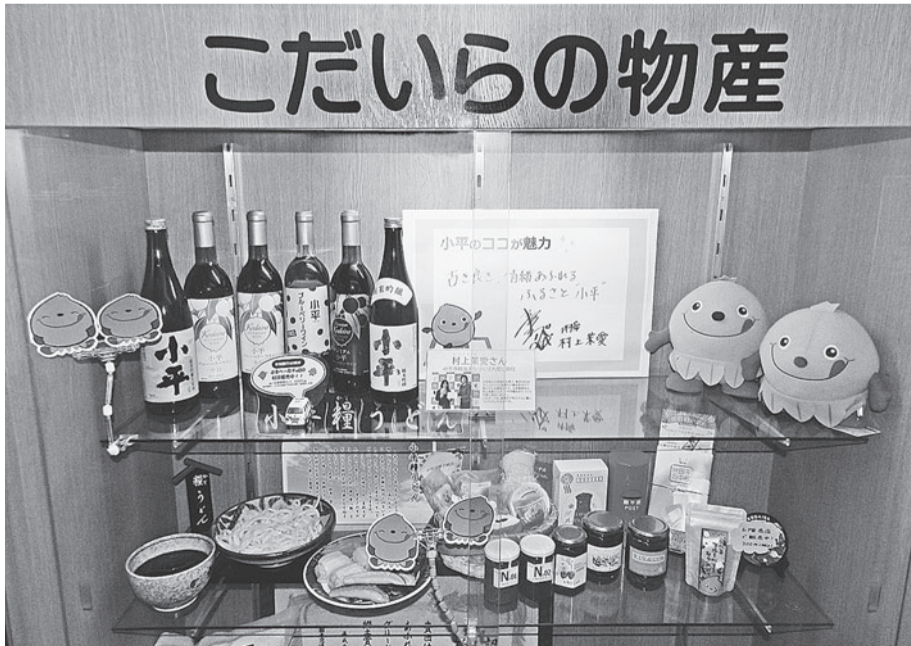
ブルーベリー加工品等を展示している市役所1階の展示棚