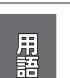
安心して住み続けられる 小平市を目指して

⑤定期予防接種を着実に実施 することを基本的な考えとして いる。現時点で任意予防接種に 対する公費助成は考えていない。