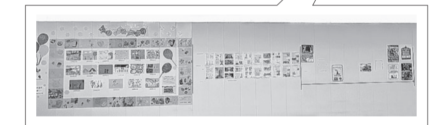
店舗の広告等が掲示されている小川駅西口の工事用仮囲いの様子