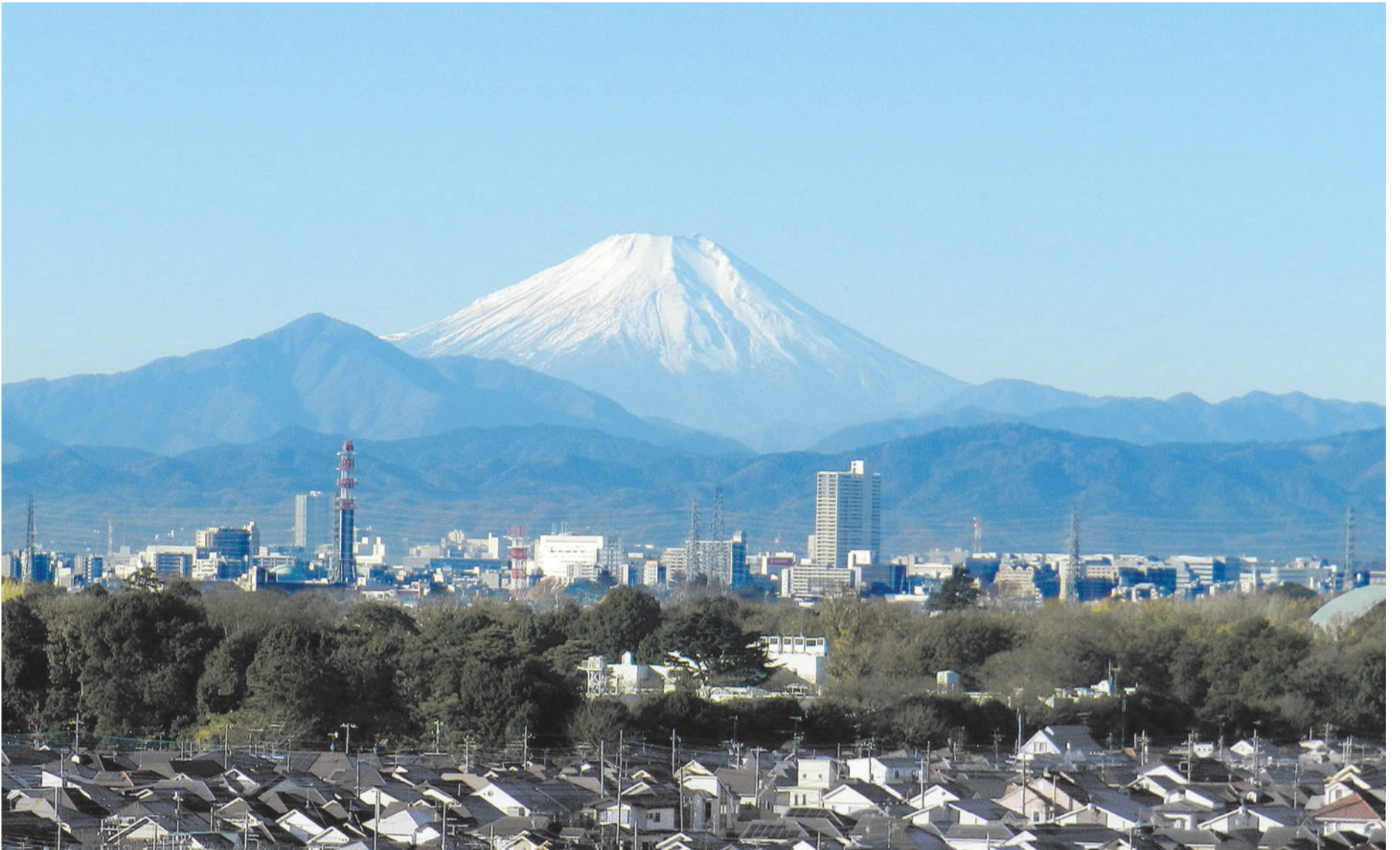
市内から望む雪化粧の富士山

令和7年(2025年)1月26日 NO.262 発行/小平市議会 編集/広聴広報特別委員会 〒187-8701 東京都小平市小川町二丁目1333番地 TEL 042(346)9566 小平市議会ホームページ https://www.city.kodaira.tokyo.jp/gikai/ 電子メール gikai@city.kodaira.lg.jp