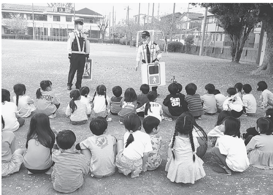
交通安全教室の様子 (小平市立学園東小学校)

教育長 ②全校で毎月1回以上安全指導日を設定し、交通安全指導等を実施している。危険を予測し回避する能力等が育成されていると捉えている。