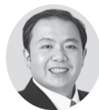
災害対応力のアップグレードを／デジタル政策参与、DX推進人材 深合幸信議員 (政和会)